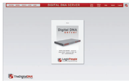
Exemples d'interfaces de la console d'administration du Digital DNA Server®